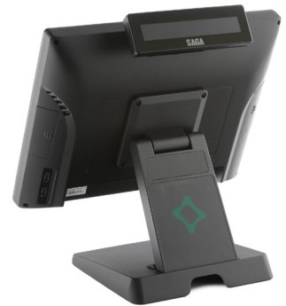
AFFICHEUR 2 LIGNES INTÉGRÉ