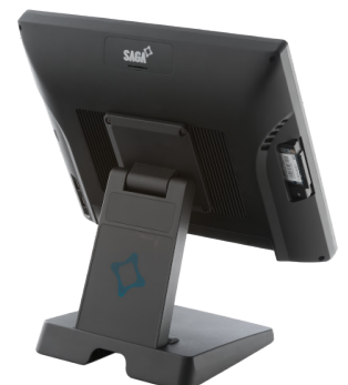
DISQUE SSD RACKABLE