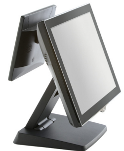
ÉCRAN CLIENT INTÉGRÉ