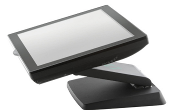
PIED Z PLIABLE LED LOGO INTÉGRÉE